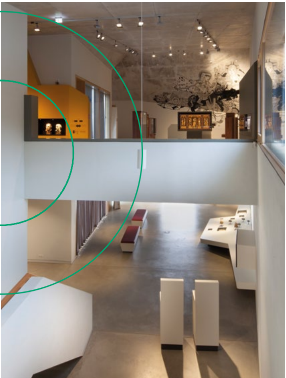
Das Museum Luthers Elternhaus in Mansfeld

Unter dem Dach der Stiftung Luthergedenkstätten in Sachsen-Anhalt kommen fünf Museen an drei Standorten zusammen: Luthers Geburts- und Sterbehaus in Eisleben, Luthers Elternhaus in Mansfeld sowie das Lutherhaus und das Melanchthonhaus in Wittenberg. Diese authentischen Schauplätze erzählen in ihren Ausstellungen mit historisch einmaligen Exponaten die spannende Zeit der Reformation. Große und kleine Besucher erfahren an diesen UNESCO-Weltkulturerbestätten alles über das Leben, das Werk und das Wirken Martin Luthers und Philipp Melanchthons.