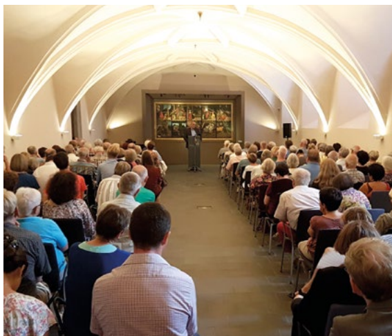
Das Refektorium im Lutherhaus dient oft für Veranstaltungen

2021 gründete sich der »Freundeskreis der Stiftung Luthergedenkstätten e. V.« – kurz: Freundeskreis der LutherMuseen – und hat es sich zur Aufgabe gemacht, die Stiftung Luthergedenkstätten bei der Erfüllung ihrer Aufgaben zu unterstützen – egal ob ideell, materiell oder finanziell. Er möchte Impulse zu neuen Projekten geben, sie fördern und die Museen durch seinen Einsatz in Wittenberg, Eisleben und Mansfeld nachhaltig stärken. Dafür setzt der Freundeskreis eigene Mittel ein, sammelt Spenden und gewinnt Sponsoren.